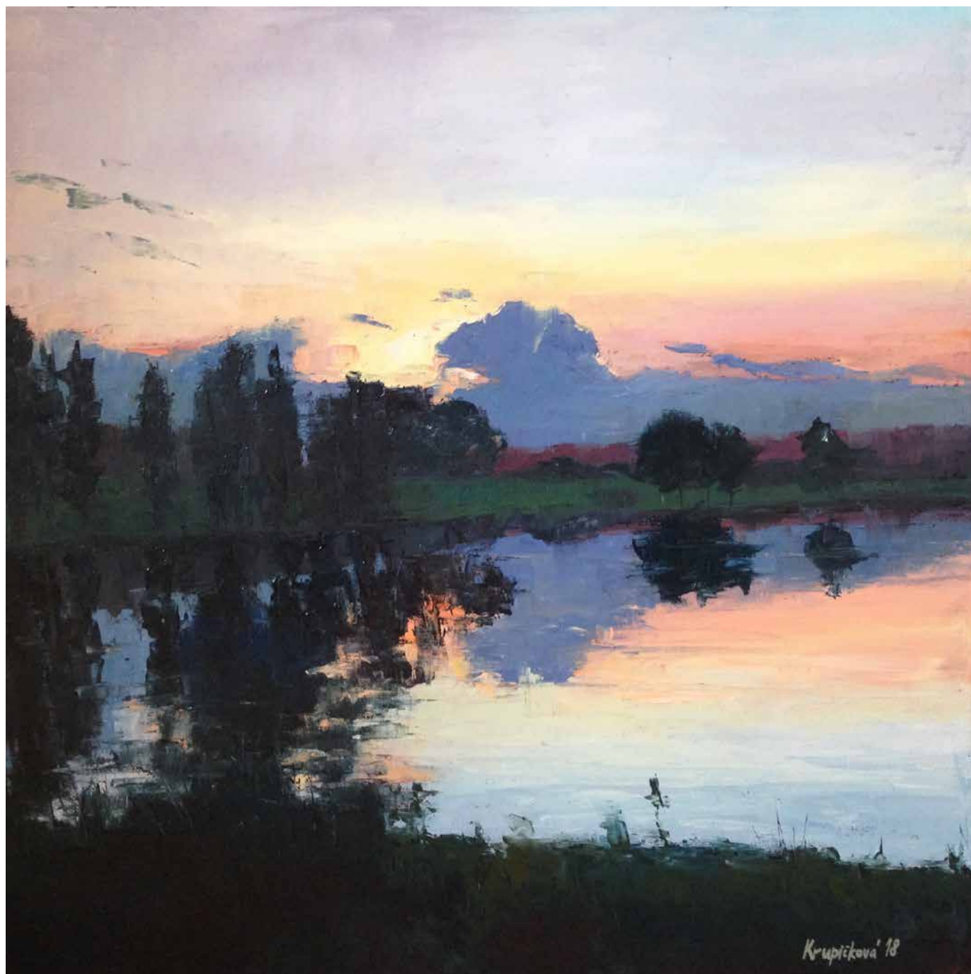
Pohled z vlaku I (2018)